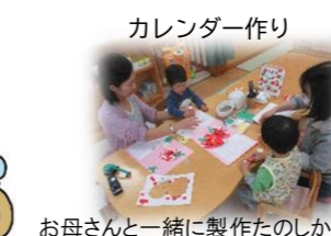
お母さんと一緒に製作たのしかったね!