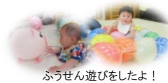
ふうせん遊びをしたよ!