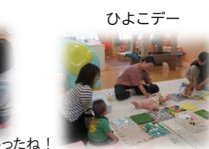
お母さん方で情報交換や、めごちゃんはずつたりのんびり。可愛い姿をたくさん見せてくれました。