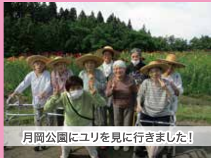
月岡公園にユリを見に行きました!