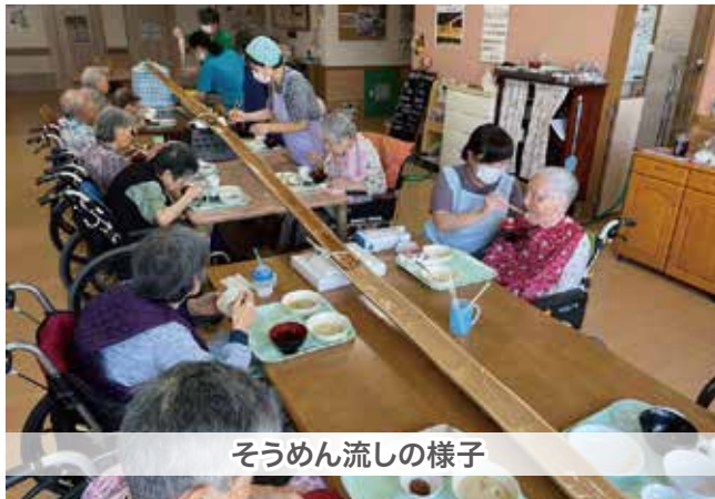
そうめん流しの様子